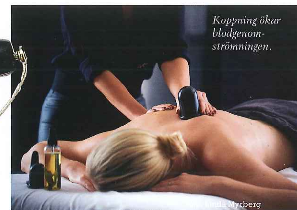
Koppning ökar blodgenomströmningen.

Utöver setet med sugkoppor har hon även tagit fram en signaturbehandling, by Myrberg Aroma Cupping, som inkluderar kropps- och ansiktsmassage med eteriska oljor, akupressur och sugkopporna. Behandlingen kan utföras med fyra olika effekter, Detox, Relax, Energi och Grounding. *