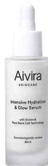
Aivira Skincare Intensive Hydration & Glow Serum , 695 kr/30 ml. Lätt, mjölkigt serum som absorberas snabbt och gör huden silkeslen och återfuktad, med hjälp av den fuktbindande stjärningrediensen ectoin.

mot yttre påfrestningar. Danska Beauté Pacifique letar ständigt efter nya, verksamma ingredienser – även i det marina segmentet.