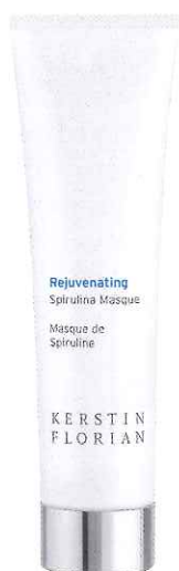
Kerstin Florian Rejuvenating Spirulina Masque , 629 kr/ 80 ml. Grön ansiktsmask fullproppad med antioxi- danter och annat hud- godis. Här finns bland annat spirulina, chlorella och fucusalg som sätter sprutt på cirkulationen och gör underverk för glämgig hud.